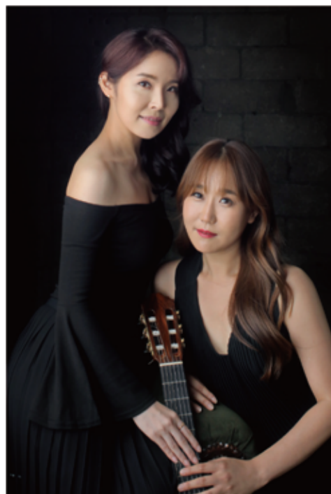
"Botti" Guitar Duo

"작고 여린 손가락에서 나오는 이토록 아름다운 소리와 표현은 믿을 수 없다" - to 한은 by 엘리엇 피스크 "활력 넘치고 가장 강력한 연주자로 언제나 설득력 있는 연주를 선사 한다" - to 허유림 by 데일 카바나호